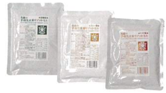
・和風味 ×1食(171kcal) ・カレー味 ×1食(207kcal) ・トマト味 ×1食(225kcal) 各200g