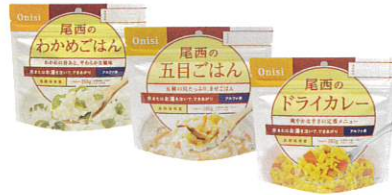
・わかめごはん ×1食(363kcal) ・五目ごはん ×1食(377kcal) ・ドライカレー ×1食(361kcal) 各100g