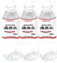
北アルプスの保存水 500 ml × 3 本