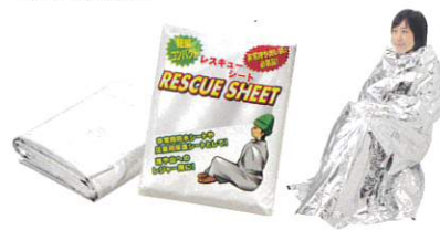
・サイズ：約213×137mm ・材質：アルミ蒸着PET

天候の急変などの非常時に雨・風や気温の変化から身を守るための軽量緊急用シートです。アルミ箔が体温の低下を防止します。防水、防風用としてもお使いいただけます。