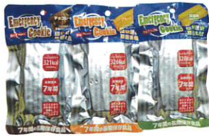
・チョコレート味 ×1袋(321kcal) ・プレーン味 ×1袋(326kcal) ・抹茶味 ×1袋(328kcal) 各60g